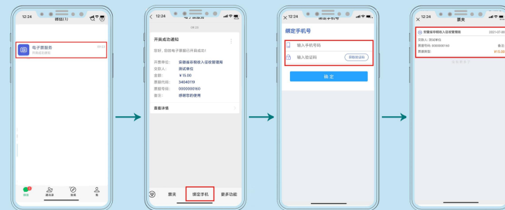
点击电子票服务公众号