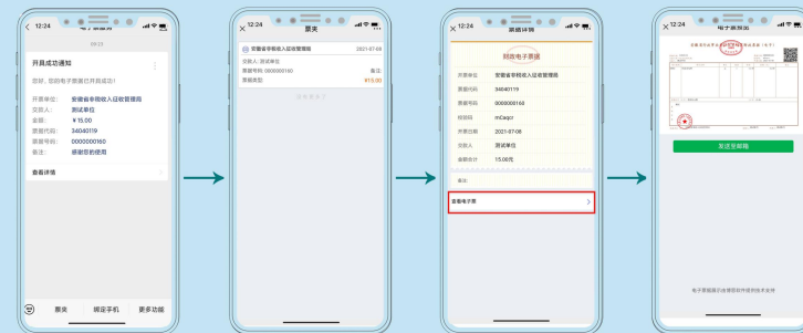
查看个人所有票据